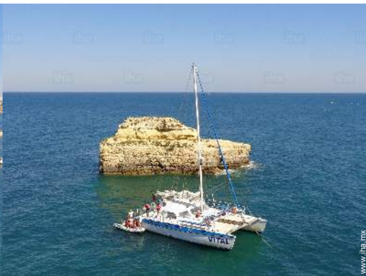
actividades de ocio de verano cercanas