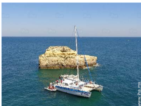
actividades de ocio de verano cercanas

" Casa de planta baja consta de 1 dormitorio con cama matrimonial, tv, sofá cama, 1 cuarto de baño con ducha, cocina con estufa, horno, nevera, microondas y fregadero. El exterior tiene una estufa, mesa y sillas para un exteriores de comidas adecuado. Porción del estacionamiento "