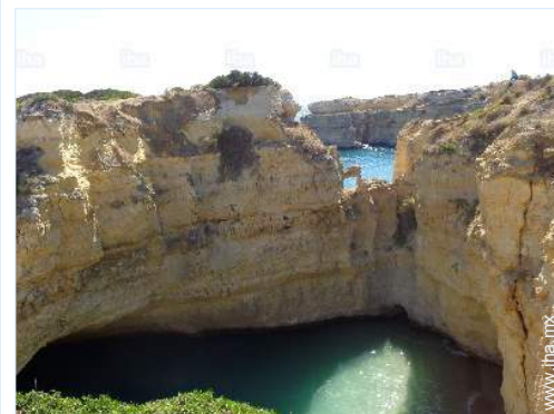
actividades aéreas cercanas

Parada/estación de guagua 300m Catering 200m Supermercado 200m Peluquería 500m Cajero automático 200m Farmacia 1km