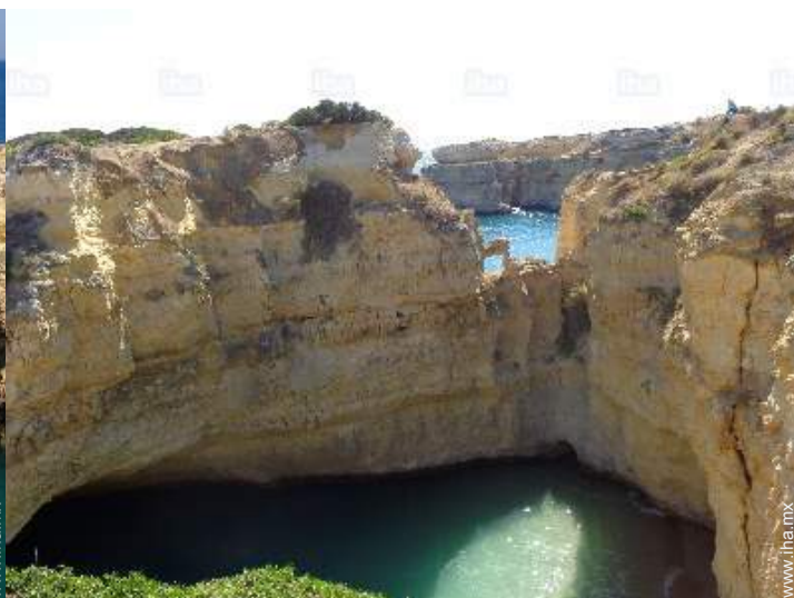
actividades aéreas cercanas