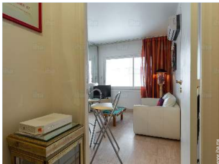
acceso internet alta velocidad