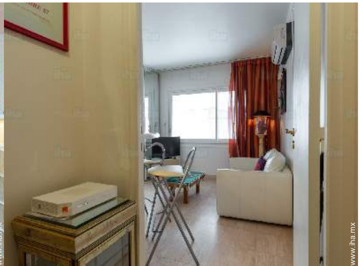
acceso internet alta velocidad