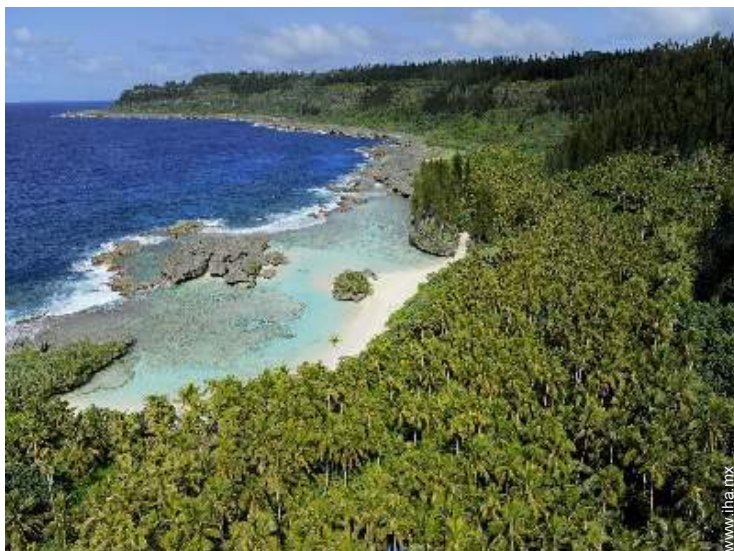
playa de arena