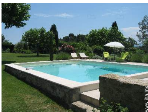
vista sobre la piscina