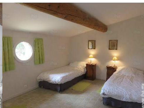
cama de matrimonio