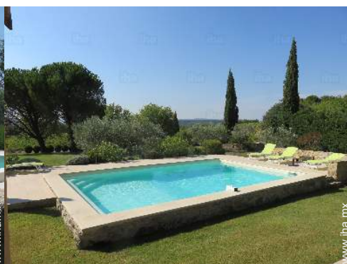
vista sobre la piscina