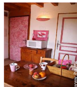
Disposición interior a disposición de los huéspedes