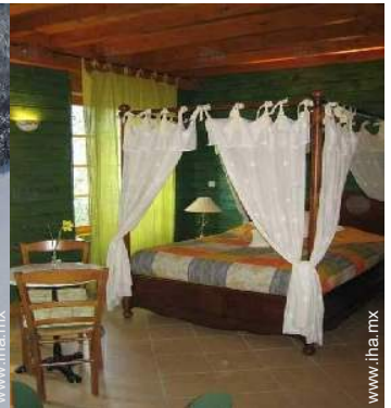
La habitación de huésped