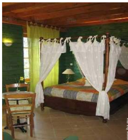
La habitación de huésped