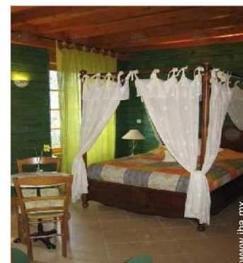
La habitación de huésped