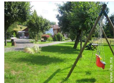
Marco exterior a disposición de los huéspedes